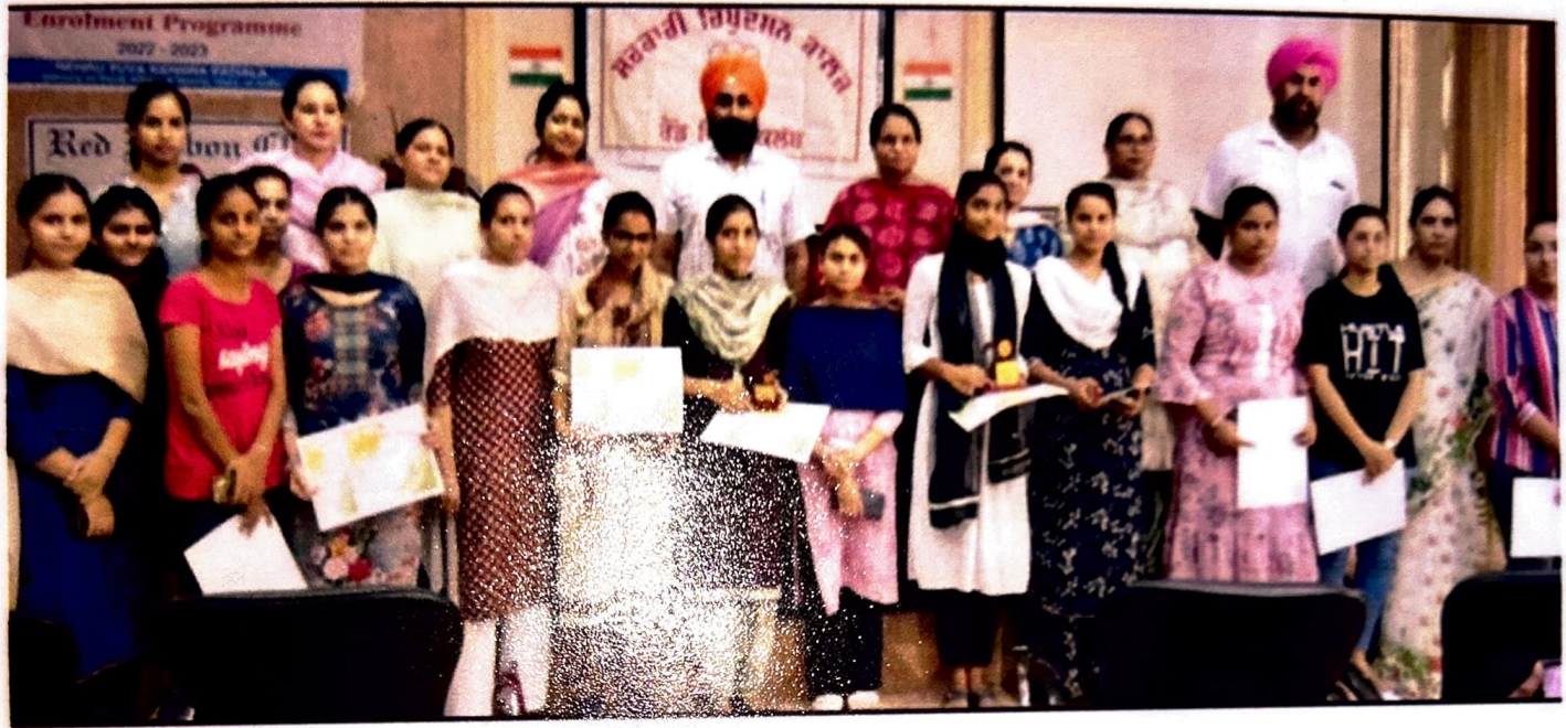
सरकारी रिपुदमन कॉलेज में रैड रिबबन व एनएसएस गर्ल्स यूनिट की ओर से अलग-अलग गतिविधियों में भाग लेने उपांत पुरस्कार प्राप्त करते हुए विद्यार्थी।